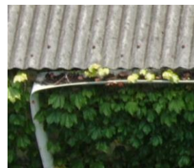
雨樋の雑草詰まり