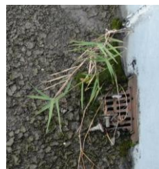
排水溝の雑草群生